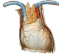
19-21 Perikard (Kreislauf)

19 Blutdruck und Puls werden heruntergefahren 20-21 Antibiotika und Allergiemittel werden besonders gut aufgenommen Phase der Erholung und Entspannung der Hauptorgane bei Störungen treten Depressionen auf